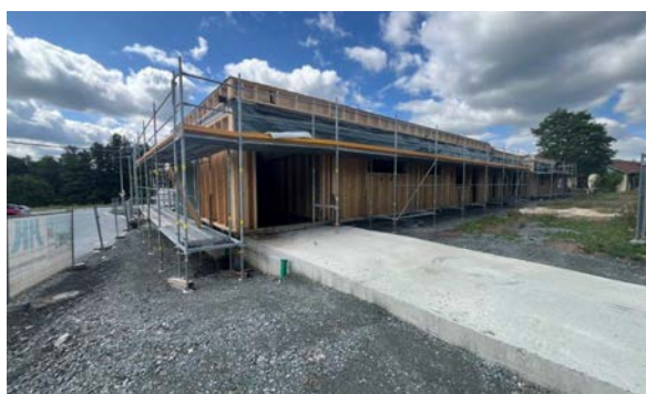
Nach der Aufstellung des Gebäudes wurde um das Gebäude ein Gerüst aufgestellt, um die Arbeiten auf dem Dach sowie der Fassade zu ermöglichen.