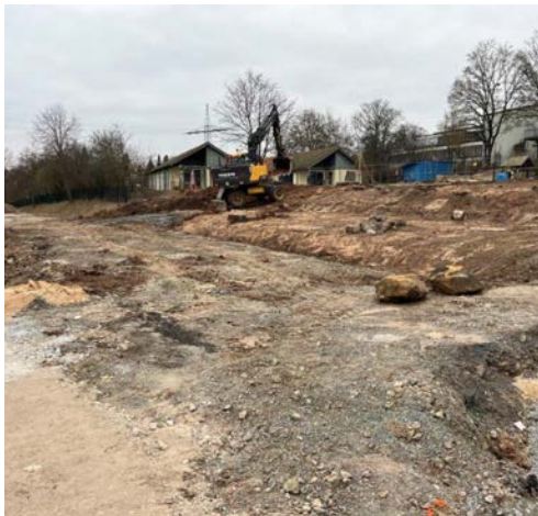
Zu Foto links: Beginn der Erdarbeiten und des Bodenaustausches als vorbereitende Maßnahme für die Schaffung des Fundaments.