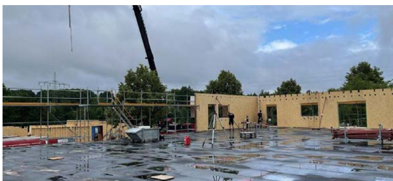
Beginn des Aufstellens der einzelnen in Holzständerbauweise gefertigten Außen- und Innenwände. Die Wände wurden vorher in der Zimmerei gefertigt und durch einen Tieflader zur Baustelle transportiert und dort durch die Zimmerei aufgestellt.

Baustellenbericht (Fotos / Bericht: S. Hübner, Bauamt)