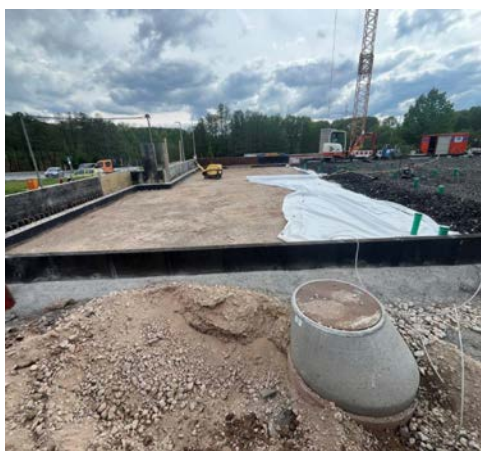
Einbau und Verdichtung von recycelten Material und nachhaltigem Glasschaumschotter als Unterbau für das Fundament.