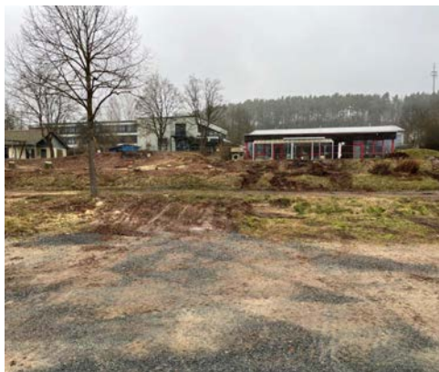
Zu Foto links: Momentaufnahme vor dem Beginn der Erdarbeiten für den Neubau der viergruppigen Kinderkrippe neben der Bestandskrippe, die im Zuge der Baumaßnahme miteinander verbunden werden.