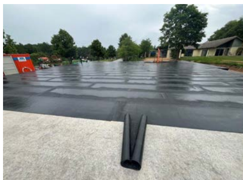
Zu Foto links: Abdichtung des gegossenen Fundaments mittels Schweißbahn.