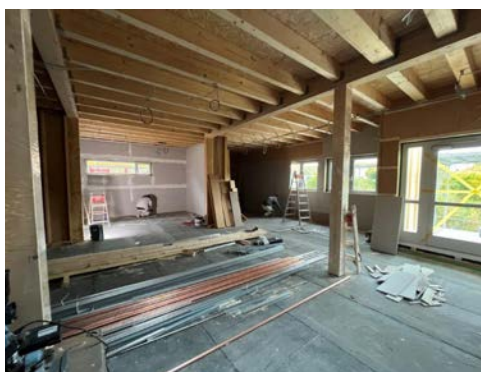
Zu Foto links: Nach der Abdichtung des Daches, sowie dem Einbau der Fenster und Außentüren konnte zeitgemäß mit dem Innenausbau begonnen werden.