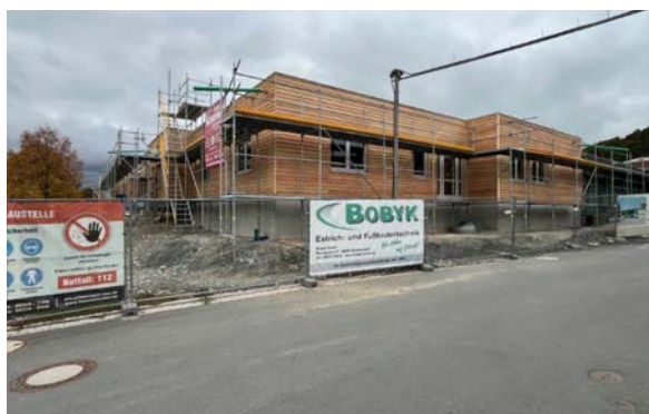
Zu Foto rechts: Zeitgleich wurden durch die Zimmerei auch die Arbeiten an der Fassade, die aus Lärche besteht, begonnen.