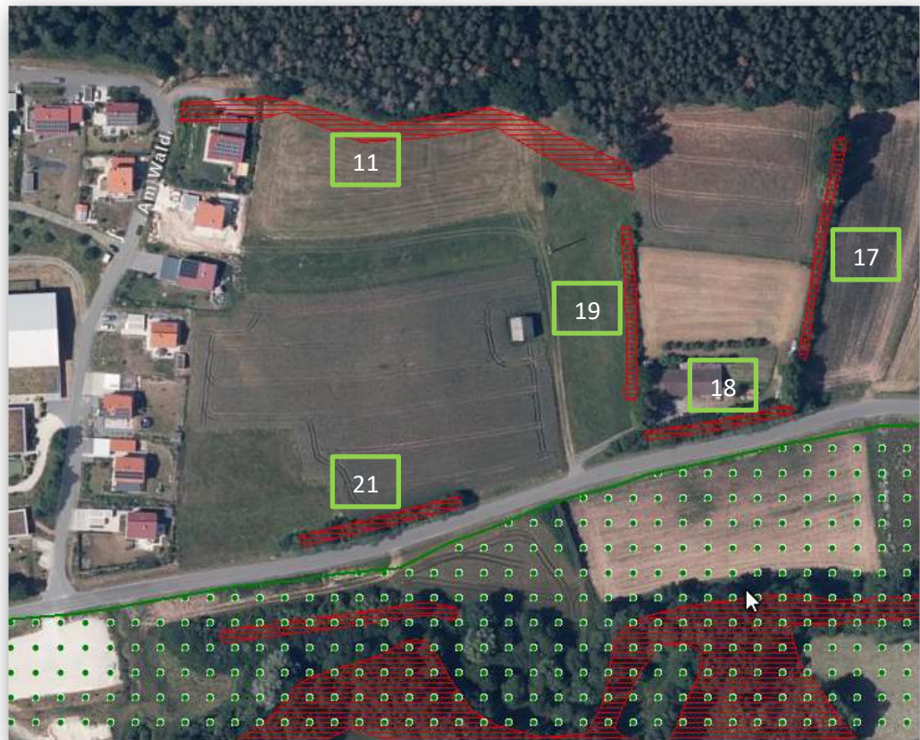
Auszug Bayernatlas - Umwelt

Biotopeflächen Nrn. 17, 18, 19 und 21: Hecken, naturnah (100%) - Schutz nach Art. 16 BayNatSchG in Verbindung mit § 39 Abs. 5 BNatSchG